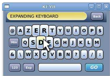
Figure 2 : L'application test clavier en mode "expanding keyboard".

Nous avons expérimenté la réalisation d'une application test par un designer graphique utilisant Hayaku afin d'illustrer la méthode proposée.