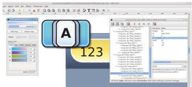
Figure 3 : Le fichier SVG de description des éléments graphiques du clavier, réalisé avec Inkscape.

Le travail d'élaboration graphique a été réalisé avec Inkscape (cf Figure 3). Dans un premier fichier SVG, le designer a créé tout d'abord une touche du clavier par couches graphiques superposées. 8 calques sont définis dont un calque lumière activé lors de l'appui de touche (événement curseur Press ) et un groupe de calques pour réaliser l'ombre portée. Ces calques sont nommés et groupés en un unique composant SVG. Pour tester la composition globale, les touches sont ensuite dupliquées, organisées et modifiées pour générer une maquette de principe du clavier. La création visuelle de la zone supérieure, incluant l'afficheur texte, une touche "backspace" et un fond dégradé, complète cette maquette.