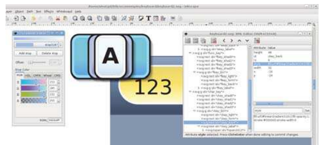
Figure 3 : Le fichier SVG de description des éléments graphiques du clavier, réalisé avec Inkscape.

Le travail d'élaboration graphique a été réalisé avec Inkscape (cf Figure 3). Dans un premier fichier SVG, le designer a créé tout d'abord une touche du clavier par couches graphiques superposées. 8 calques sont définis dont un calque lumière activé lors de l'appui de touche (événement curseur Press ) et un groupe de calques pour réaliser l'ombre portée. Ces calques sont nommés et groupés en un unique composant SVG. Pour tester la composition globale, les touches sont ensuite dupliquées, organisées et modifiées pour générer une maquette de principe du clavier. La création visuelle de la zone supérieure, incluant l'afficheur texte, une touche "backspace" et un fond dégradé, complète cette maquette.